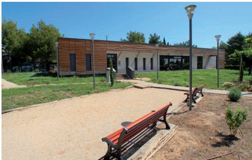
Espace seniors Les Cigales