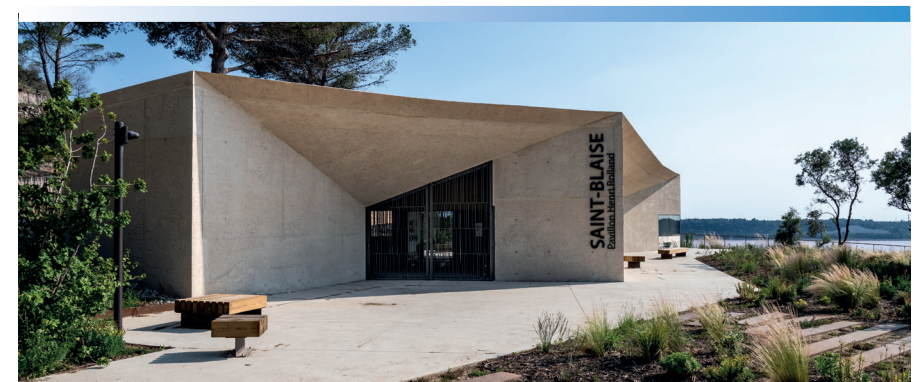
Photo : Pavillon Henri Rolland - Site archéologique de Saint-Blaise - Saint-Mitre-les-Remparts