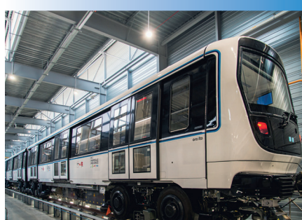
Rame de métro assemblée au sein des ateliers RTM - Marseille