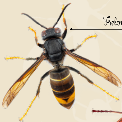
Frelon asiatique à pattes jaunes

Le référent est formé gratuitement par FREDON PACA/GDSA13 sur la reconnaissance des espèces de frelons, de leurs nids et la connaissance des techniques de piégeage et de destruction