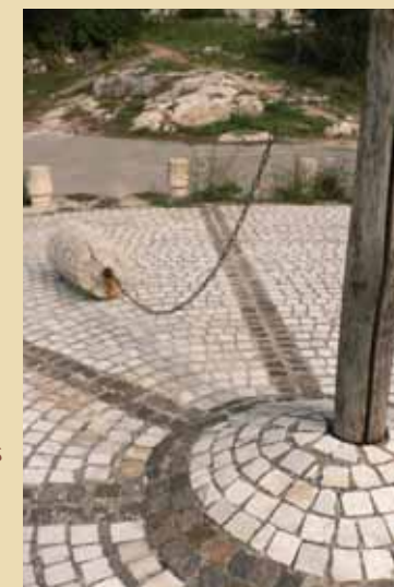
Aire de Battage / Les Boyers

ont de longueur modeste, la plus longue atteint quelques dizaines de mètres. La plus courte fait moins de dix mètres. Il n'a pas été possible de dater avec précision leur construction mais certaines sont toujours utilisées aujourd'hui !