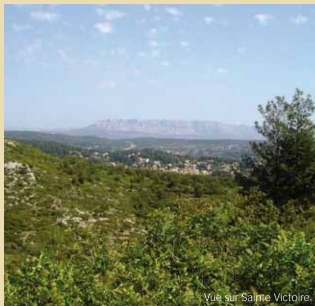
Vue sur Sainte Victoire