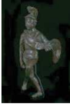
19. Casque de parade avec victoire ailée, 3ème ap. JC (MmoCA inv. 607)