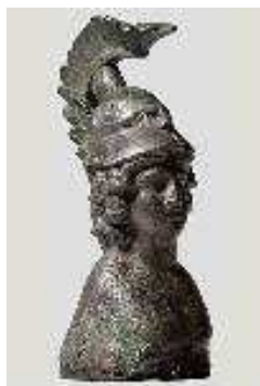
18. Statuette en bronze de Mars avec casque et cimier, 2-3ème ap JC (MmoCA inv. 82)