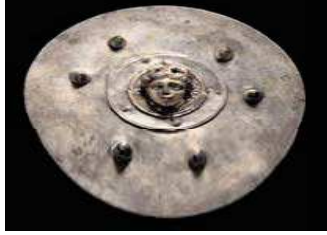
31. Electrotype du casque de Ribchester, 20 ème siècle (MmoCA inv. 812)