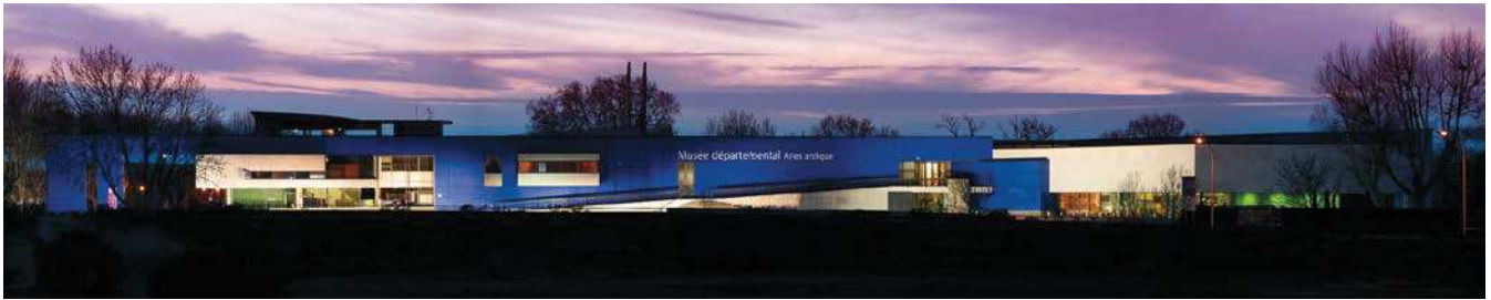
Musée départemental Arles antique

Les renseignements contenus dans le présent rapport sont confidentiels et ne doivent être utilisés par les éventuels organismes prêteurs que pour l'évaluation des installations dans le cadre des demandes de prêt.