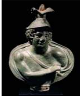
16. Insigne représentant un jeune barbare avec bulle en pendentif, 2ème ap JC (MmoCA inv. 84)